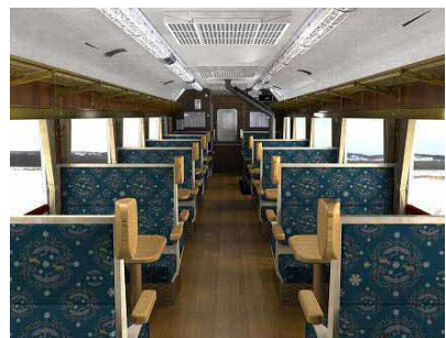
3、4号車ストーブカー イメージ