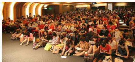
<台湾でのセミナー開催の様子>