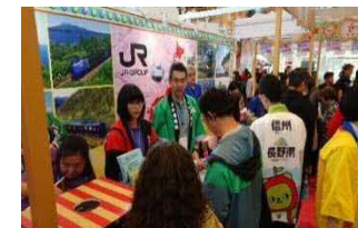
<旅行博出展の様子>