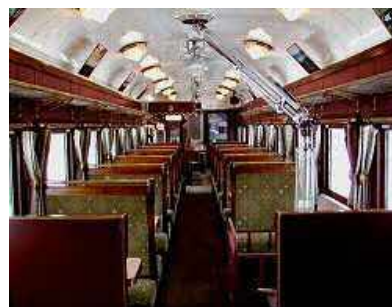
2号車カフェカー イメージ