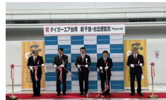
<タイガーエア初便到着時の様子 (10/16新千歳空港)>

○10月11日(火)の水際対策大幅緩和、10月30日(日)の国際線ウィンタースケジュールの開始を契機に、新千歳空港の国際線直行便も徐々に再開。これにより鉄道を利用されるインバウンドのお客様も、ピークの1月21日(土)～27日(金)の春節に向けて、回復していく見込み(中国除く)。